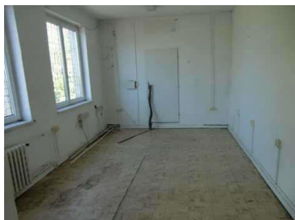
interiér obj. 04