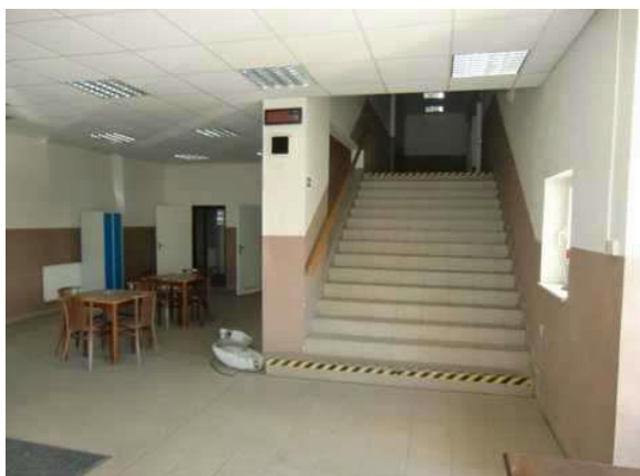
interiér obj. 04