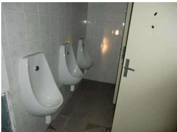
interiér obj. 03