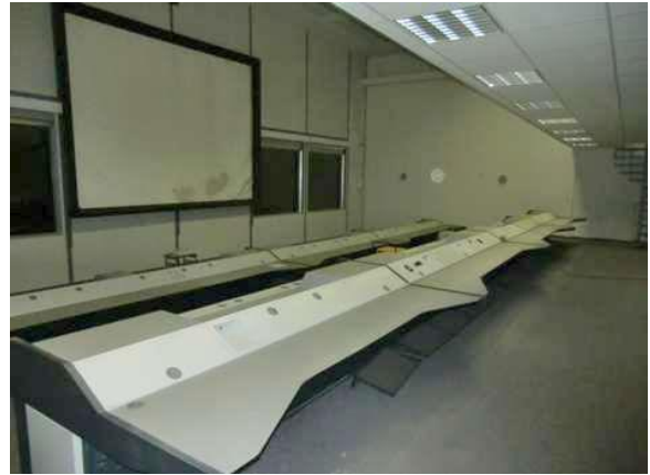
interiér obj. 03