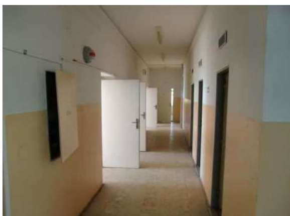
interiér obj. 04