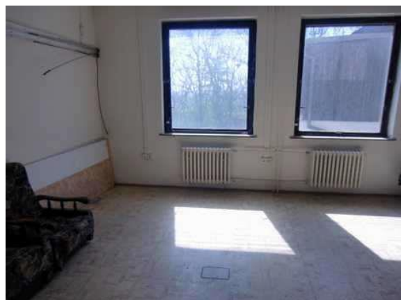
interiér obj. 04