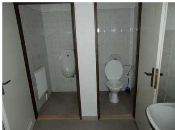
interiér obj. 04