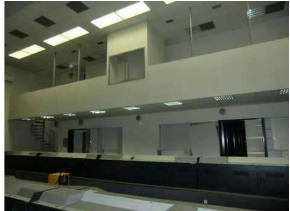
interiér obj. 03