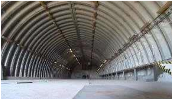
interiér obj. 03