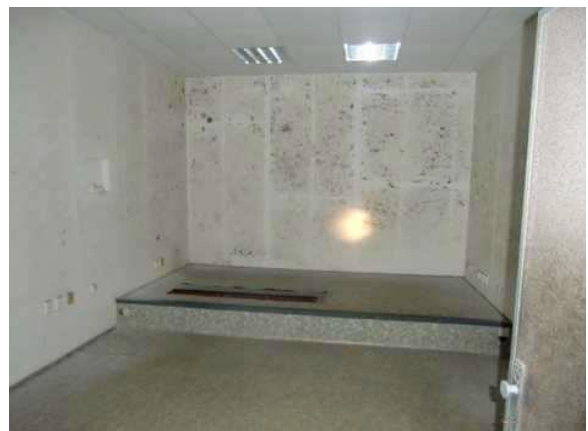
interiér obj. 03