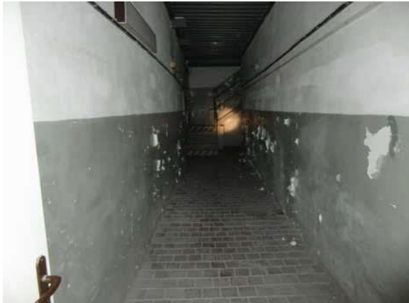
interiér obj. 03