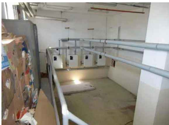
interiér obj. 04